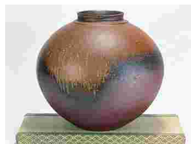
備前といえばこの風合い・・・

根強いファンも多く、侘び、寂びを感じる備前焼。 お酒の好きな方は特におなじみではないでしょうか？